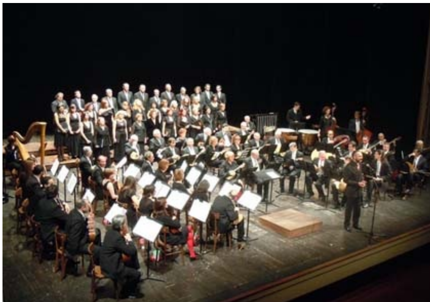
Un momento del Concerto di Capodanno nel Teatro Comunale di Ferrara

Nella prima parte si sono collocati brani che appartengono alla musica operistica, inni e canti del Risorgimento e musica originale. Dopo l'apertura con l'Inno di Mameli, è stata eseguita la Sinfonia dall'opera Norma di Vincenzo Bellini, partitura scelta in quanto il compositore catanese rappresenta il prototipo dello stile romantico italiano dei primi decenni del XIX secolo; all'interno dell'opera si trovano spesso citazioni in parallelo con la situazione politica italiana del periodo pre-risorgimentale e in alcuni cori è già presente quello spirito rivoluzionario e patriottico che accompagna la rivolta del popolo italiano sulla dominazione straniera.